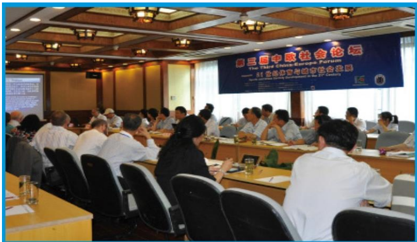
第二届中欧社会论坛（上海大学，2010）