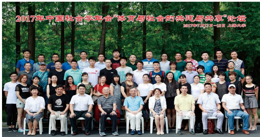
“体育与社会共建与共享”论坛（上海大学，2017）