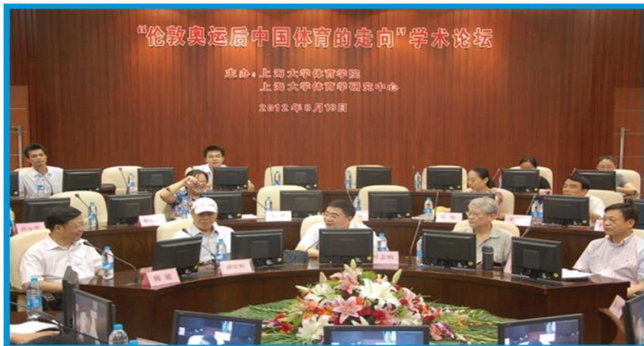
伦敦奥运后中国体育的走向（上海大学，2012）